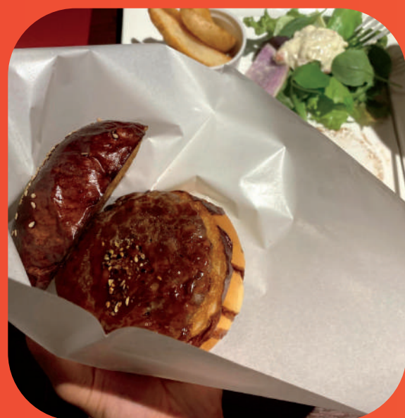
③テーブルのバーガー袋を開いて、中にバンズとパティを入れます。 (3) OPEN THE BURGER BAG ON THE TABLE AND PUT THE BUNS AND PATTY INSIDE.

ナイフ、フォークで楽しみたい方は、レッツ イート! If you want to have fun with a knife or fork, let's eat! 包んで食べたい方は、③へ。 If you want to wrap it up and eat it, go to (3).