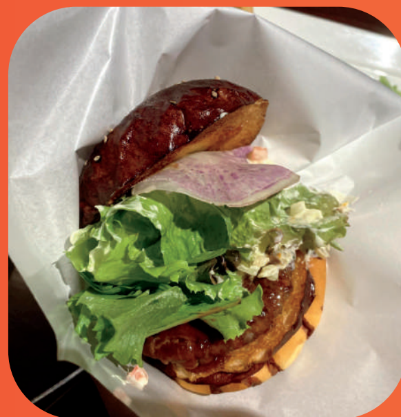
④お好きなだけ、野菜と、トッピングを挟みます。 (4) AS MUCH AS YOU LIKE, SANDWICH THE VEGETABLES AND TOPPINGS.