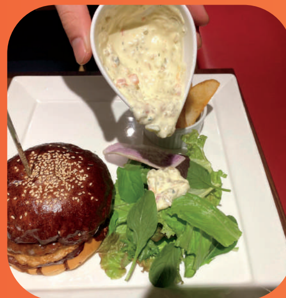
②新鮮な野菜の上に、ソースをかけます。 (2) PUT THE SAUCE ON TOP OF THE FRESH VEGETABLES