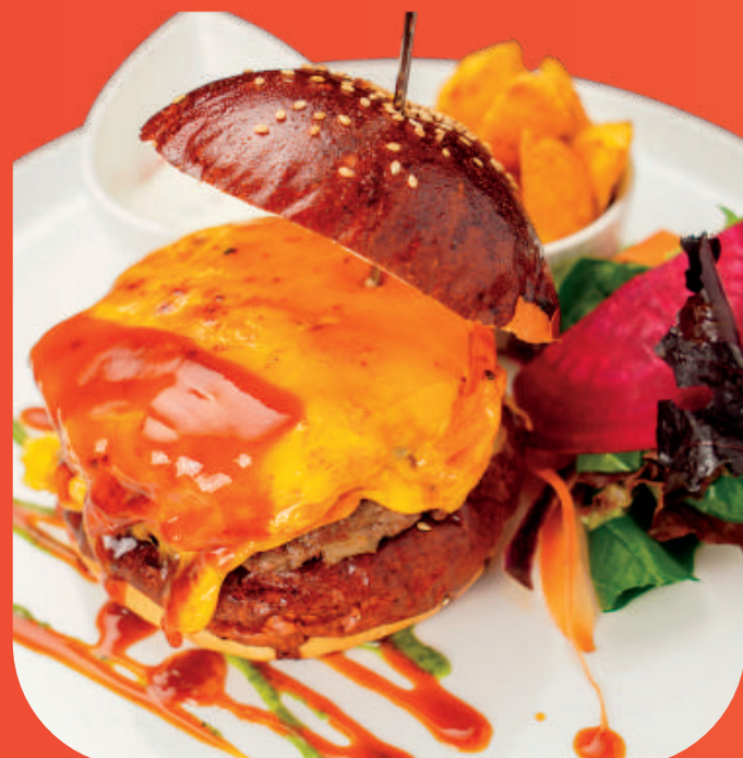
プレートが届きました! THE PLATE HAS ARRIVED!