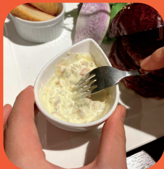
①プレートのソースを良く混ぜます (1) MIX THE SAUCE OF THE PLATE WELL!